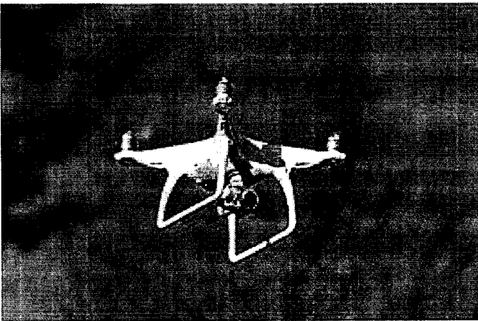
DJI Phantom 4 – гражданский БПЛА