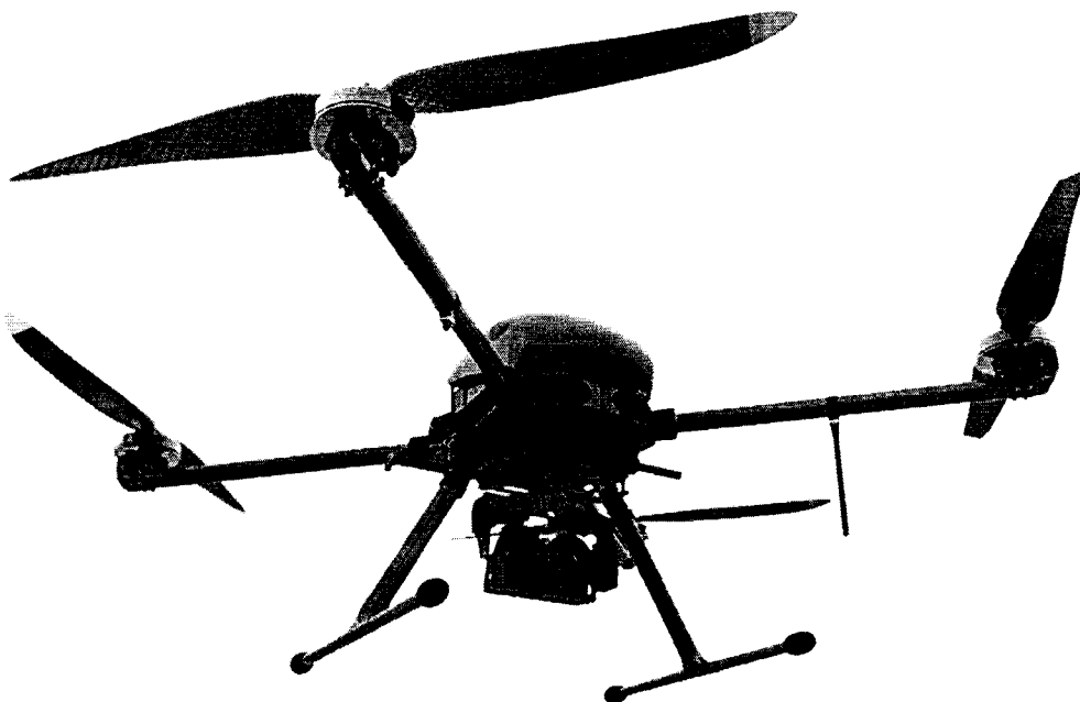
Geoscan 401 PRO